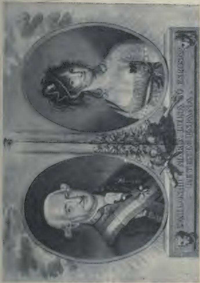
Peinture de Juan Bauxil, gravée par Rafael Esteve (1802).